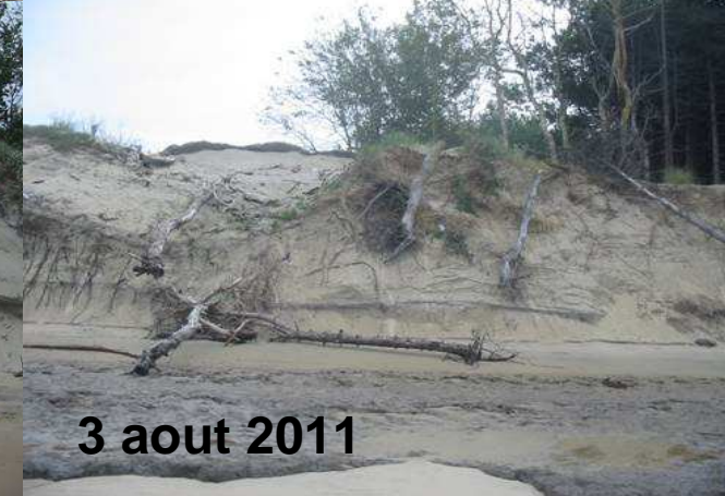
3 aout 2011