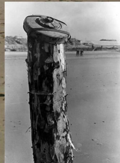
Photo de juin 2011, les socles avaient fini ensuite plus bas, enfouis dans l'Authie.