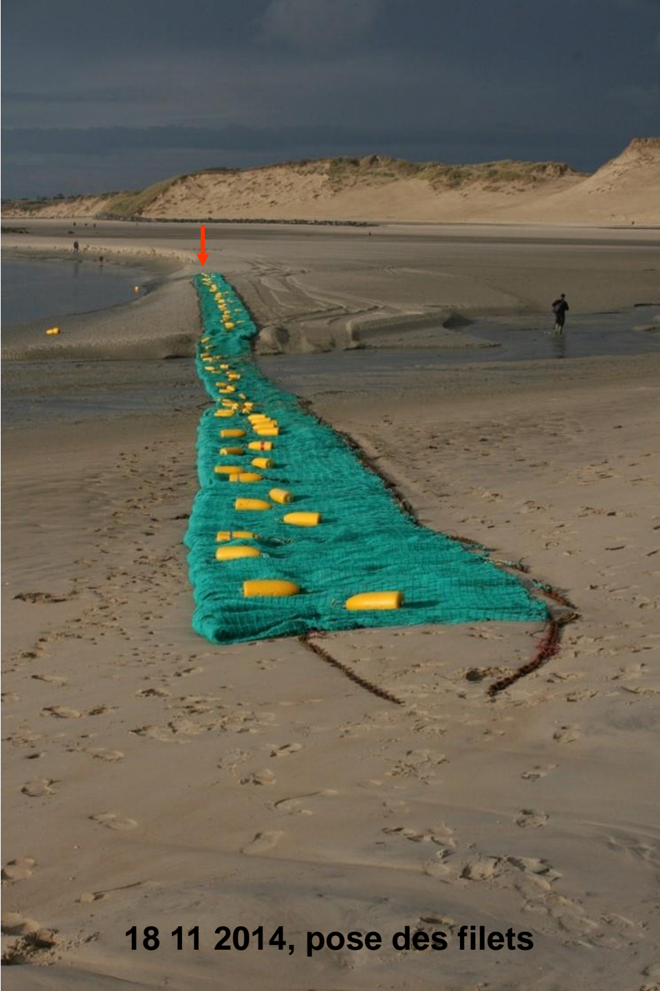
18 11 2014, pose des filets