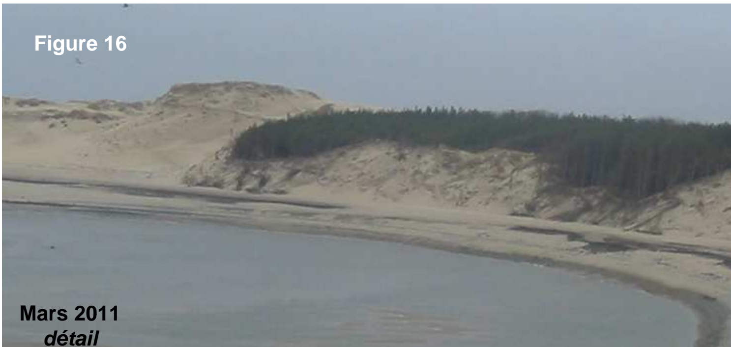
Mars 2011 détail