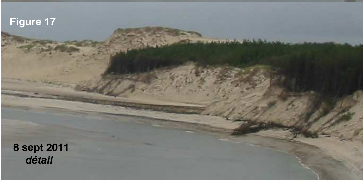
8 sept 2011 détail